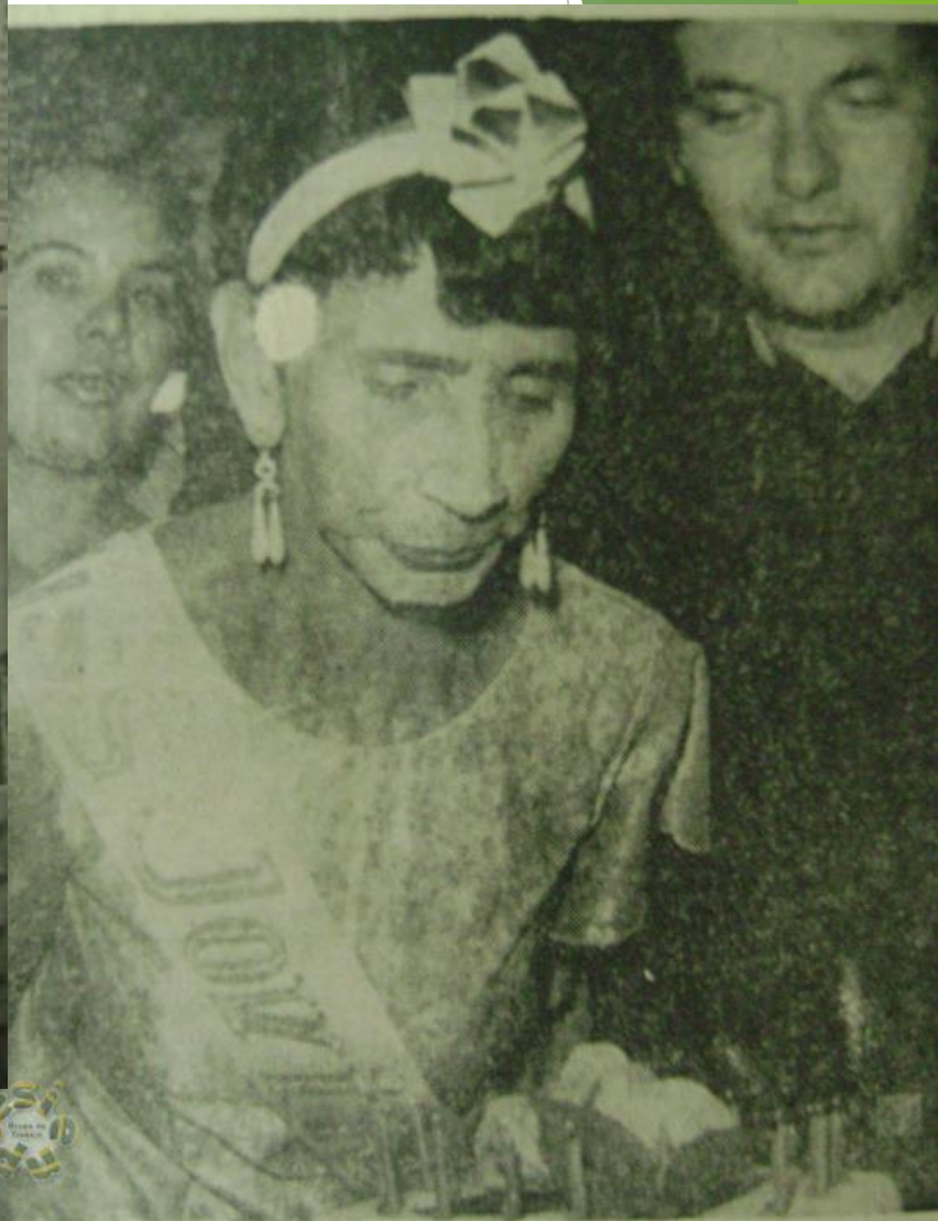
15 de Julio de 1970. Diario